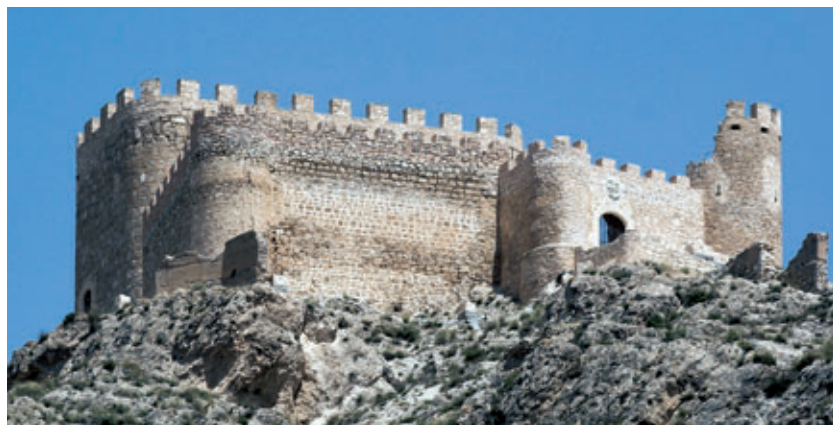
El castillo de Jumilla fue muy importante durante los siglos XI y XII.

Bajo el poder almorávide, la provincia de Tudmir formó nuevamente una unidad administrativa con Valencia. También, desde el territorio murciano se realizaron varias campañas militares contra los cristianos, como, por ejemplo, la que se emprendió contra el Cid Campeador, que se encontraba en Valencia desde el 1087.